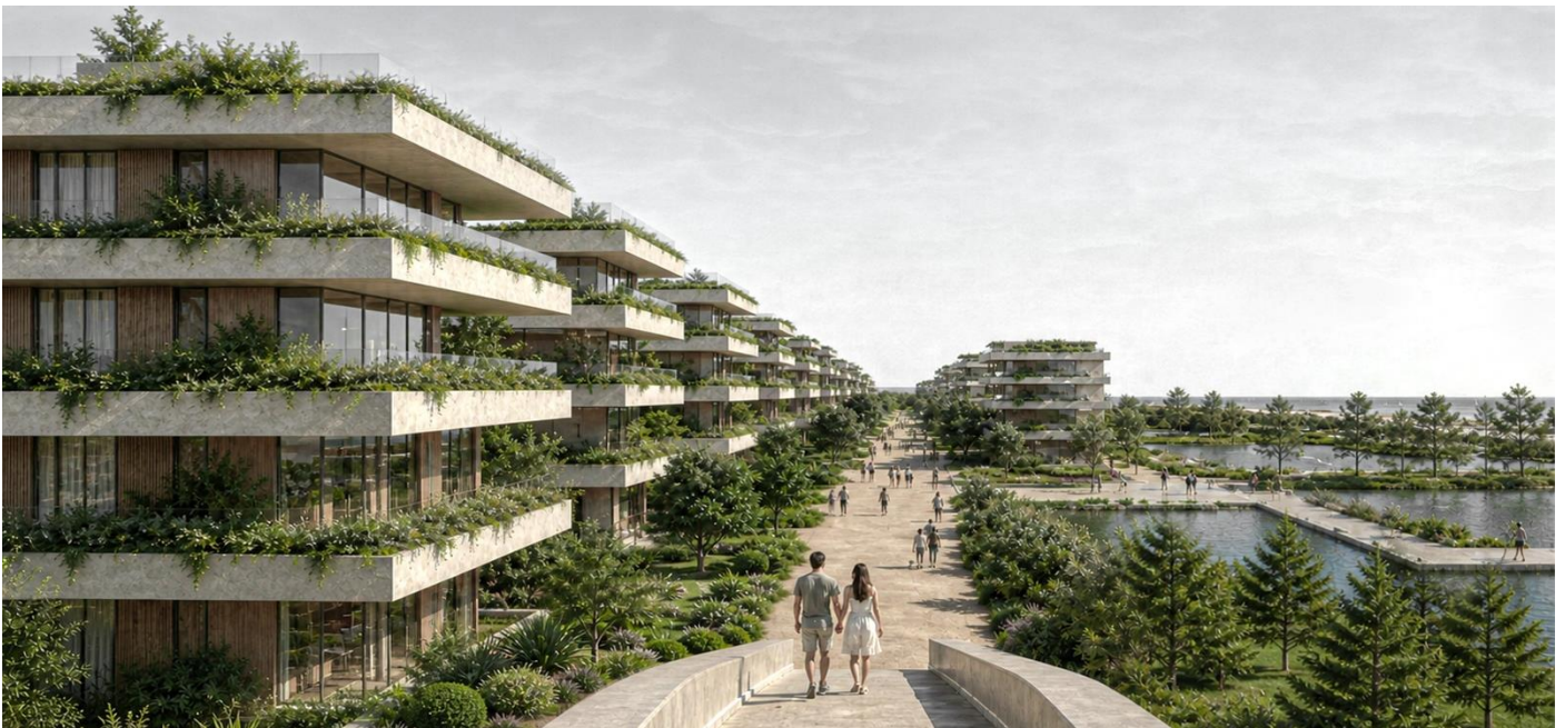
Perspectiva Peatonal Nuevo Frente Costero Miramar

El agua se integra, así como infraestructura y como material del paisaje, consolidando una identidad ambiental para el proyecto.