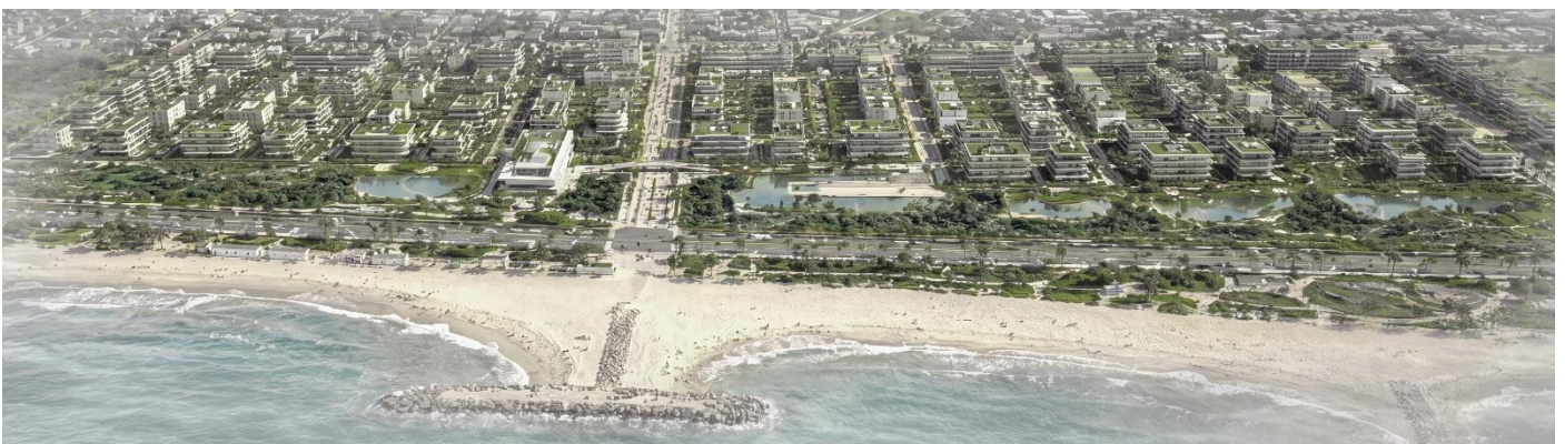
Perspectiva A Vuelo de Pájaro Nuevo Frente Costero Miramar

El frente costero deja de ser un límite para convertirse en un espacio activo de la ciudad, consolidando una nueva puerta urbana sobre el mar .