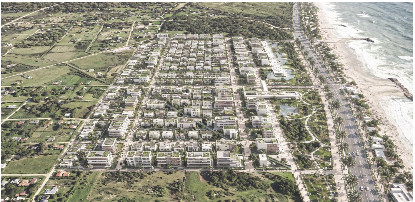
Perspectiva General Nuevo Frente Costero Miramar

Sin modificar el marco conceptual original —basado en la integración entre ciudad (preexistencia más el sitio a intervenir), paisaje e infraestructura—, el proyecto avanza hacia una mayor definición territorial, ambiental y operativa, consolidando un modelo urbano verificable y capaz de ser implementado en el tiempo.