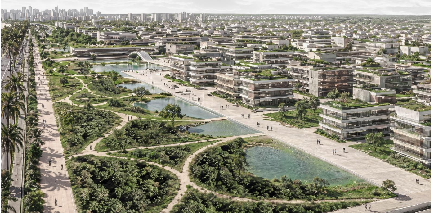
Perspectiva A Vuelo de Pájaro Nuevo Frente Costero Miramar

El proyecto se configura, así como una pieza integral donde lo público no es residual, sino el soporte principal de la forma urbana.